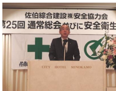
出席者全員で安全を誓った